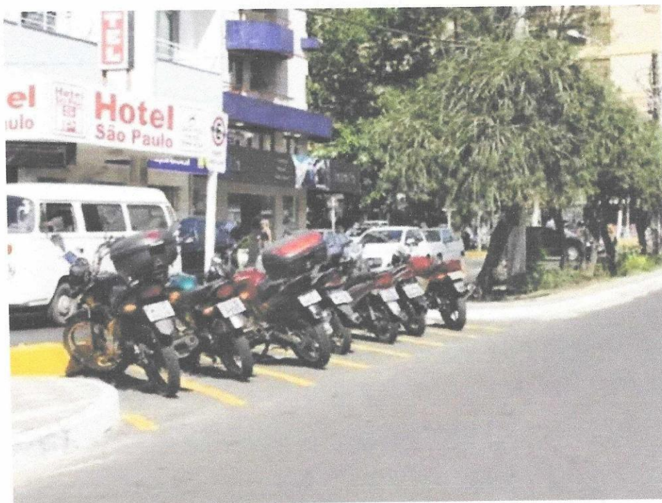
Torres- Rio Grande do Sul

Câmara de Vereadores de Balneário Pinhal Av. Itália, n 2465 - Centro - CEP 95.599-000 Fone/Fax: 51 3682.2600 - Balneário Pinhal/RS E-mail: camarabalpinhal@yahoo.com.br Site: https://balneariopinhal.rs.leg.br/