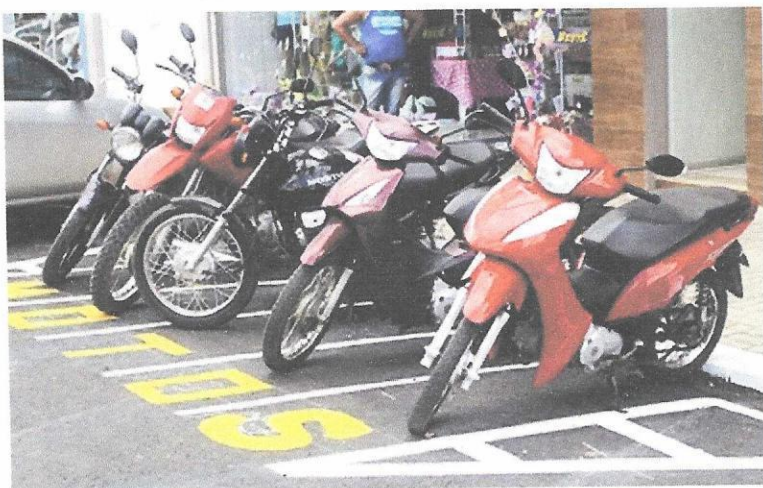
Miranda – Mato Grosso do Sul